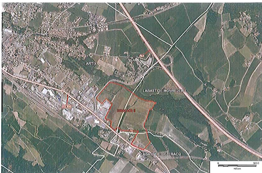
Accessibilité du projet

En terme d'urbanisation, le projet prévoit le découpage de 10 macro lots (destinés à l'accueil d'activités et pouvant être ensuite subdivisés) sur une surface de 19 hectares (192 150 m 2 ).